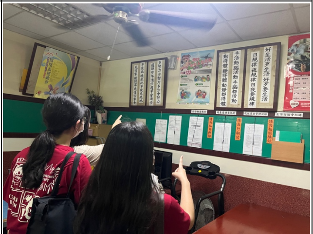
學生們討論此機構的歷史與相關得獎類容