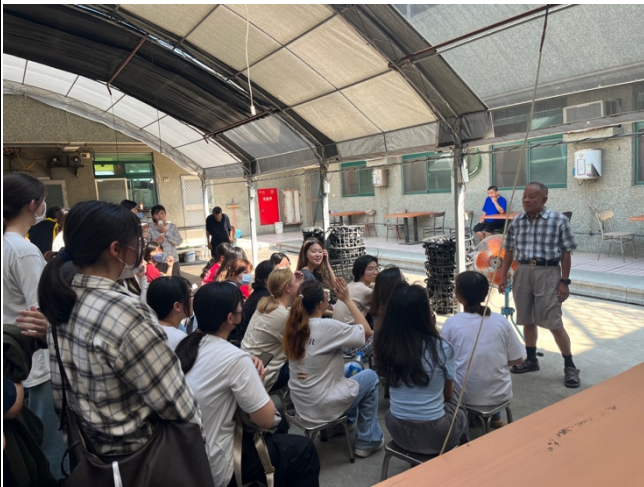
院長分享此機構的歷史