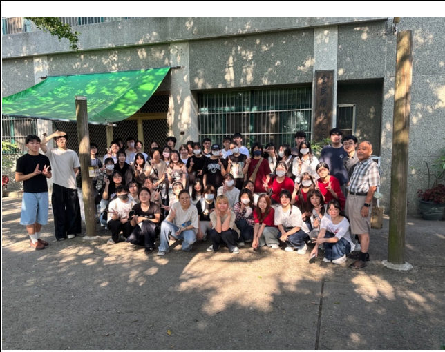
全班同學與也是職能治療師的院長大合照