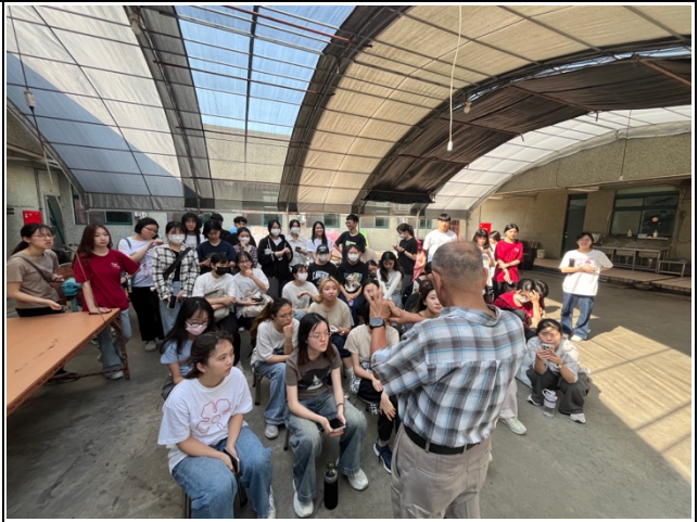
學生們向院長提問關於此機構的問題