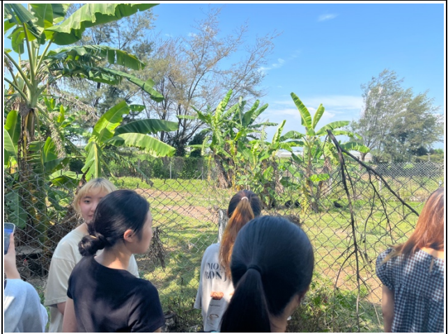
參觀學員的養雞場，可以將平時廚餘當作飼料