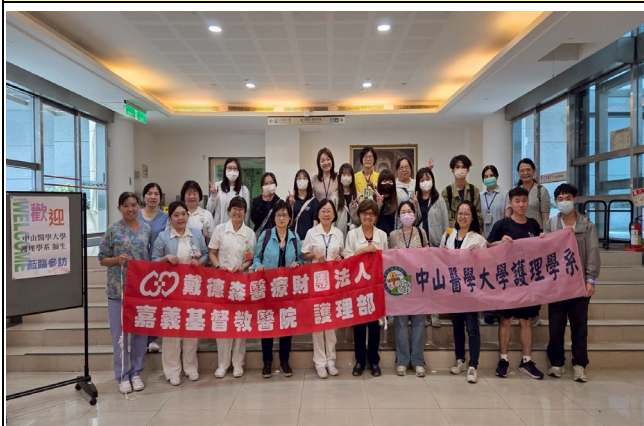
與參訪醫院大合照