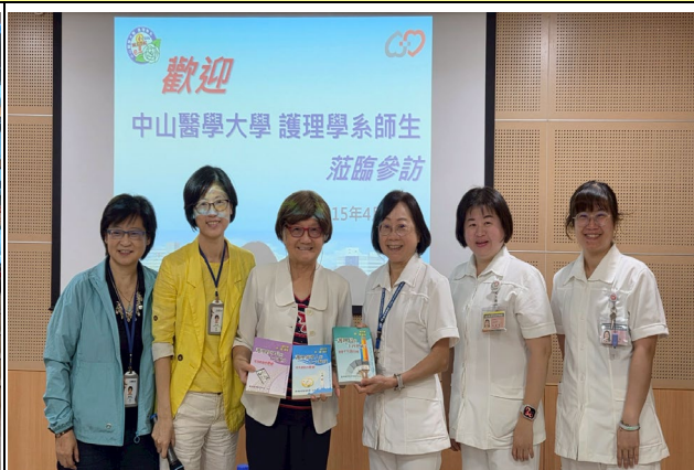
醫院護理系與本校老師合照