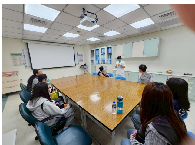
單位衛教資料運用