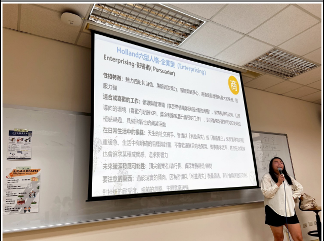
講師講解 Holland 六型人格