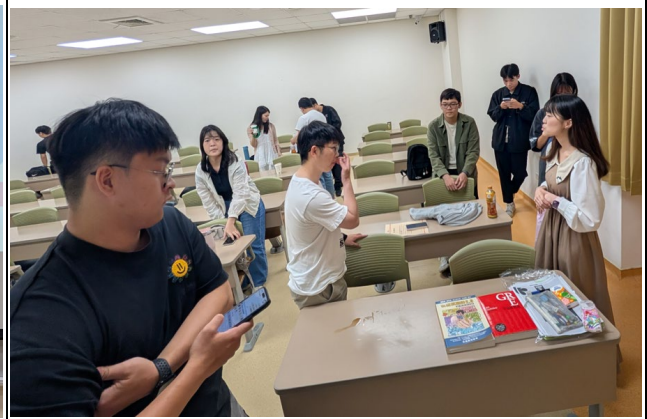
戴校友和其台積電友人回答同學提問