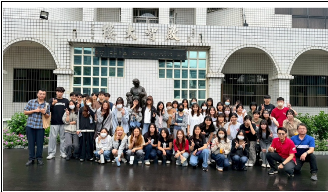
全班與機構主任與組長合影