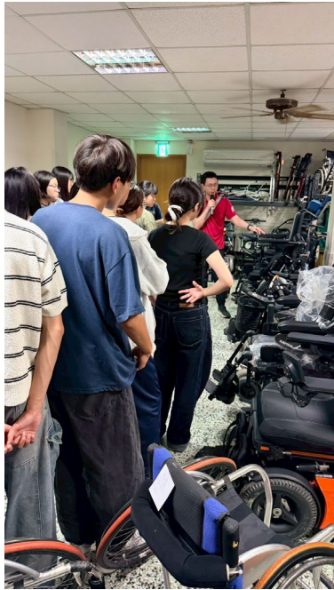
學生專心聽講不同輪椅介紹