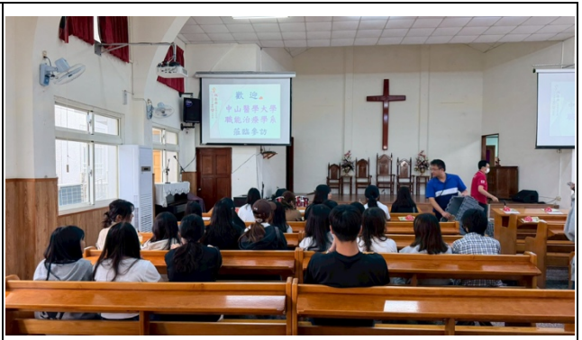
介紹機構服務對象與業務