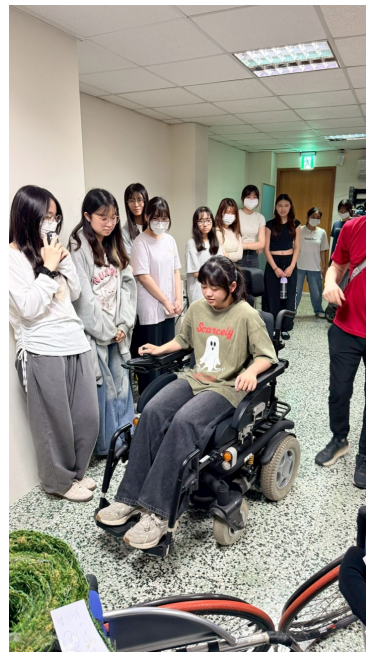
學生實際操作各式輪椅