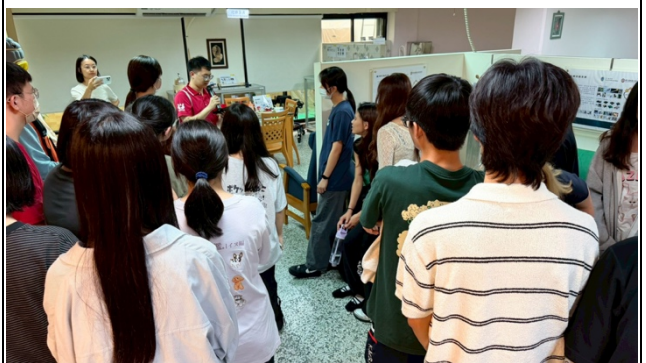
介紹各式各樣的居家輔具