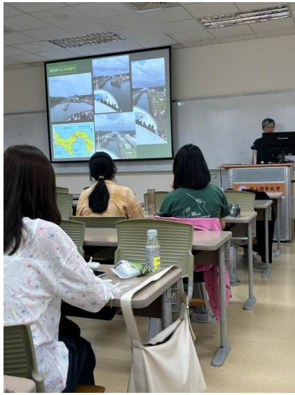
講者介紹和平船通過巴拿馬運河的沿途風景