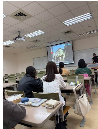
講者介紹在越南當地參訪的醫療設施