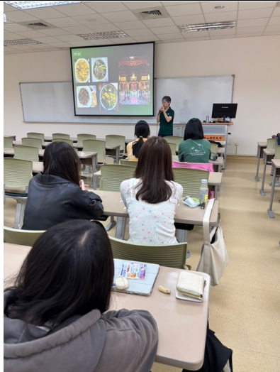
講者介紹在越南當地傳統飲食與人文風景