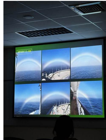
講者介紹在冰島時和平船尾目睹到的全視野彩虹景象