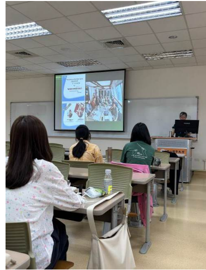
講者介紹參與極光說明會的同步翻譯志工伙伴們