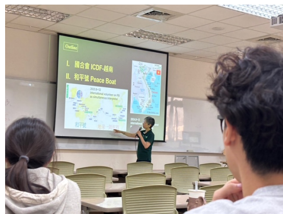
講者首先介紹今日演講內容