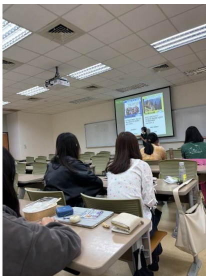
講者介紹和平船上的志工類別