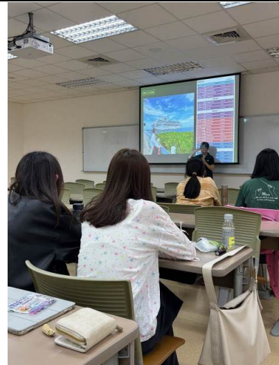
講者介紹如何申請和平船上的同步翻譯志工