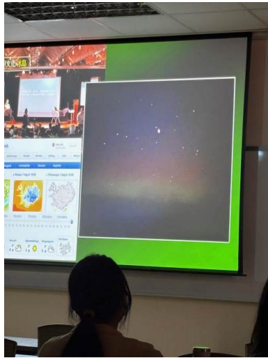
講者介紹在冰島時和平船上目睹到的璀璨極光