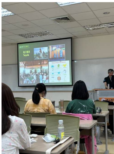
講者介紹墨西哥特產龍舌蘭酒