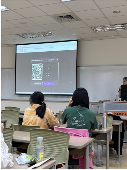
講者首先使用 Kahoot 與學生互動,初步了解他們對世界各國人文歷史的概念