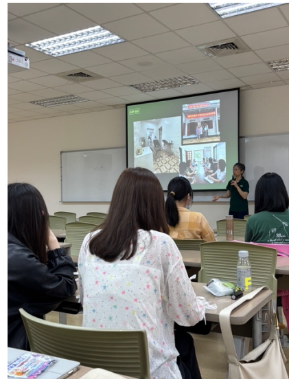
講者介紹在越南當地參訪的醫療設施