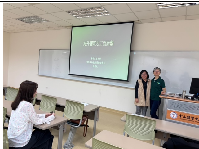
講者和與會的另一名江老師熱情互動