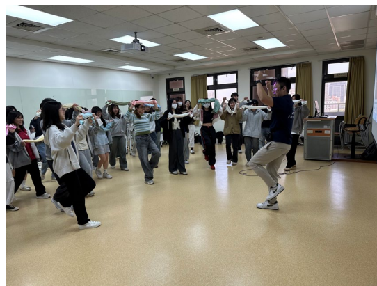
講師與同學互動式回饋