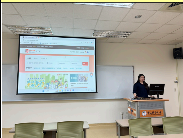
勞動部就業網站宣導