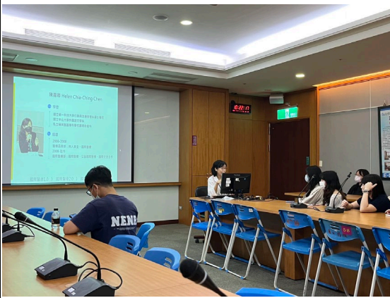
義大醫院國際醫療部高級專員 陳嘉卿 演講