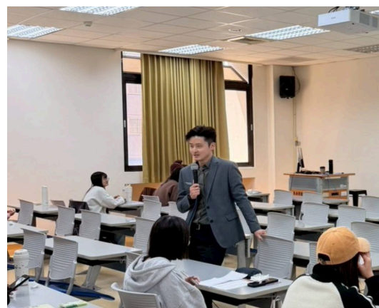
講師分享臨床案例