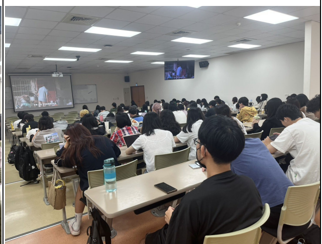
參與活動學生聆聽狀況