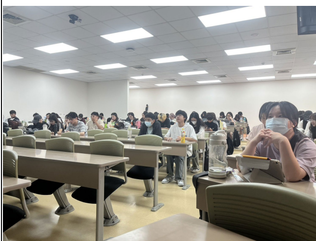
參與活動學生聆聽狀況