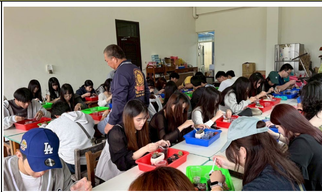
與多肉植物的實體接觸，體現綠色療癒