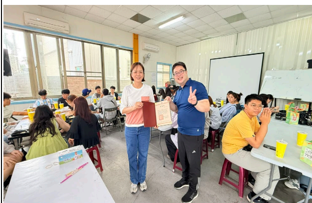
頒發感謝狀予花協單位