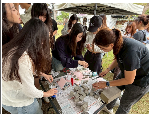
乾燥花藝手作活動進行中-園藝治療體驗