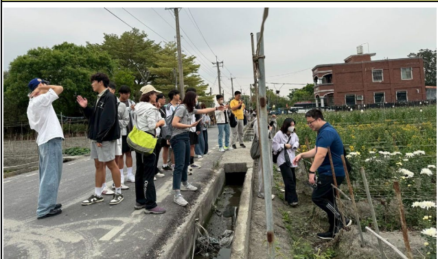
講師講解田尾特色--日照菊