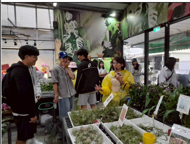
認識各類(如蘭花、多肉)植物之特性