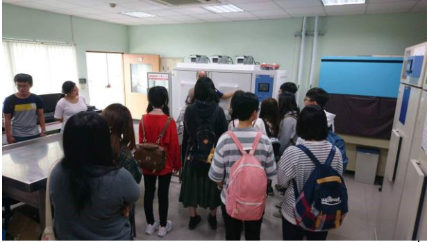
中研院南部生技中心溫室設備解說