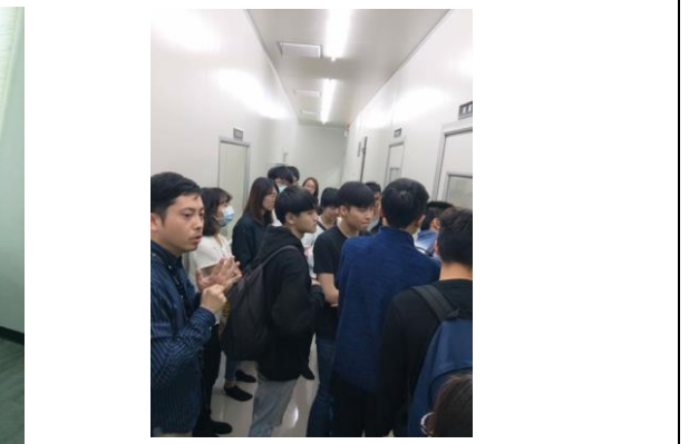
偉喬生醫董事長親自帶領並解說公司的硬體設備，和如何製造產品(抗體和檢測試劑)嚴謹的過程。