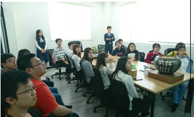
偉喬生醫執行長跟同學簡介公司業務