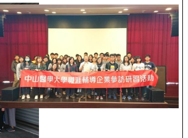
中研院南部生技園區全體合影