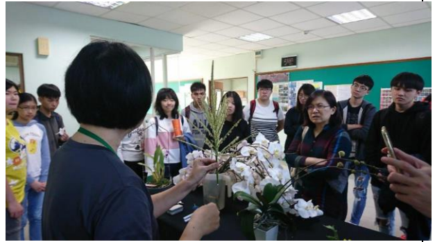
提問如何培育蝴蝶蘭和其構造的問題(有獎品)