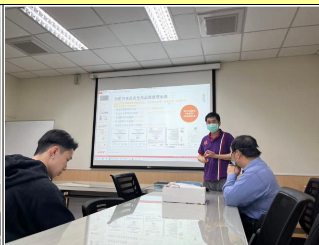
品質管理系統介紹