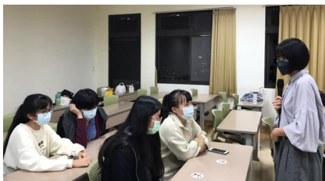
講師與同學互動情形