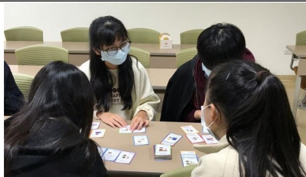
小組進行 Holland 職涯探索卡