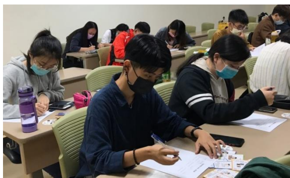
職業視窗六宮格學習單