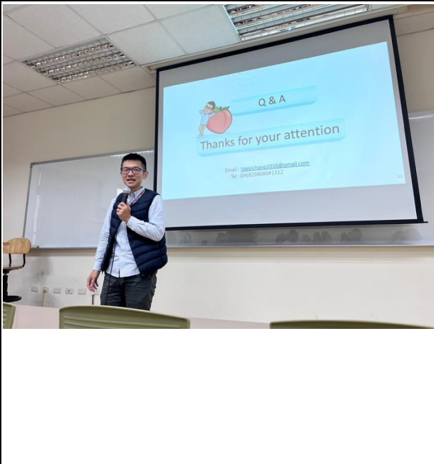
會後提問（即席座談）