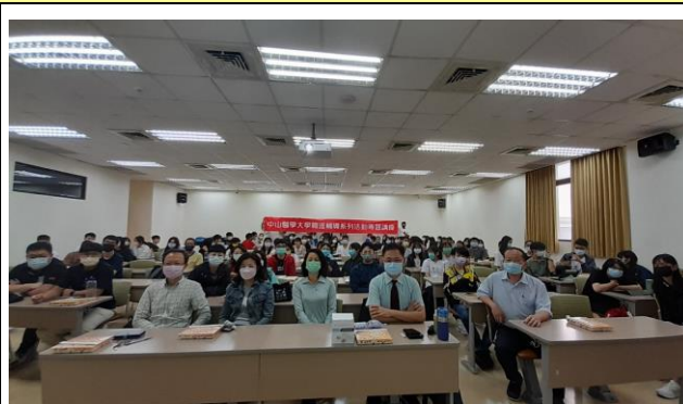
講師與全體參與人合照