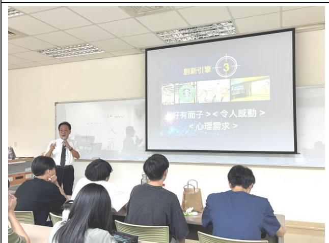
講述熱門的 AI 話題