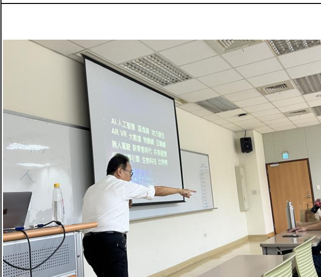
講者與同學現場互動