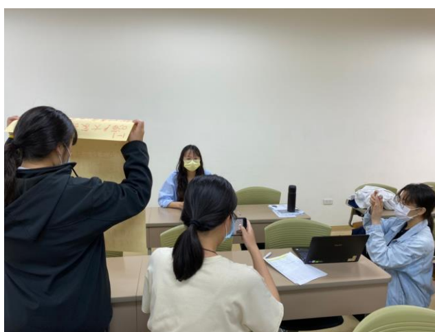
同學實作練習情形