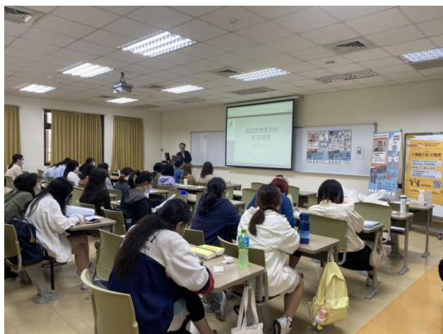
專業老師演講情形