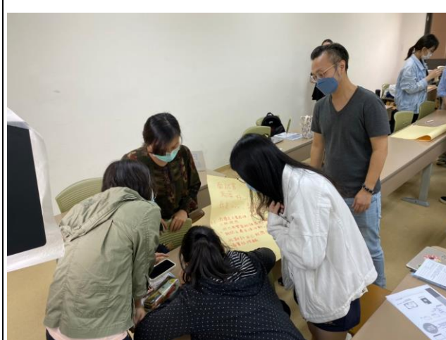
同學實作討論情形