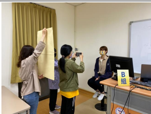
同學實作練習情形