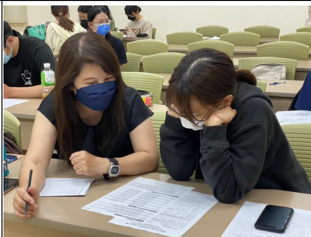
學生與顧問諮詢情形