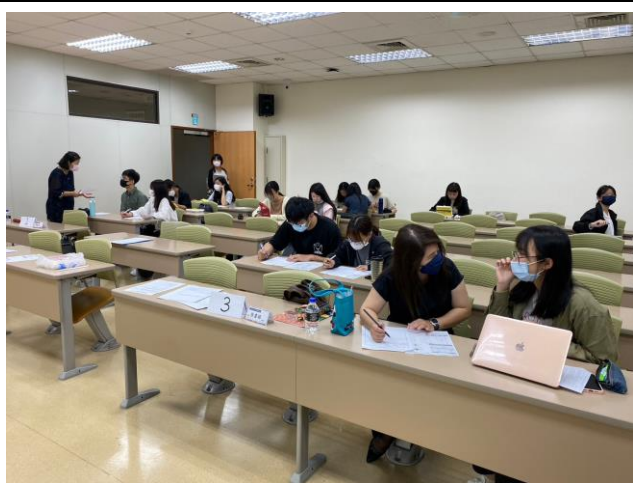
分組進行諮詢情形