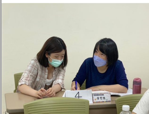
學生與顧問診諮詢情形