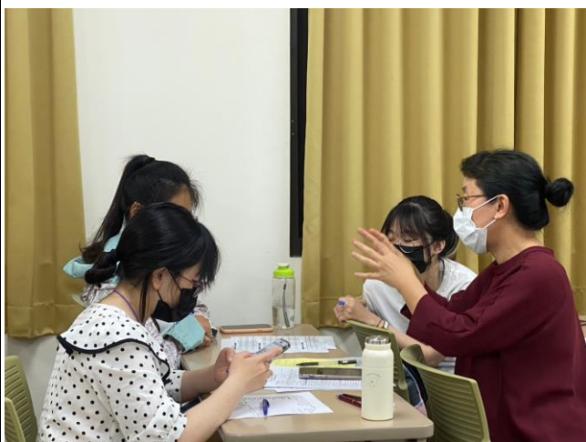
顧問與學生團體解說測評涵義