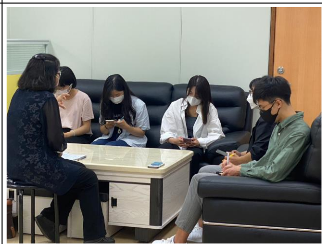
顧問與學生團體解說測評涵義