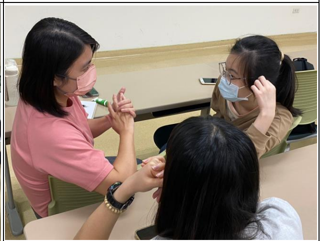
同學溝通練習情形