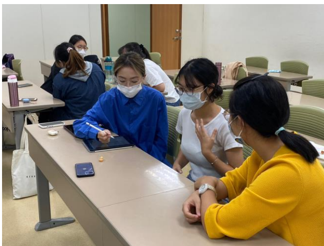
同學溝通練習情形